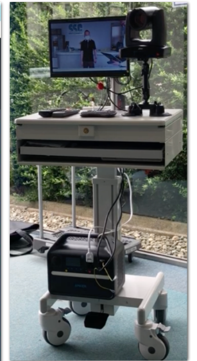
AI自動撮影カメラ設置のご相談も承ります。